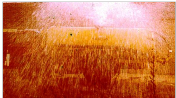
▲ Bovenop ligt de sproeikop met spreidplaat die haaks op de rijrichting sproeit.

Bij een brand in De Rips moest men naar Anton Koenen bellen 0493-296. Meestal pakte Doortje op. Ze vroeg dan bij wie en in welke straat de brand was en hing de telefoon snel op. Vervolgens snelde ze naar het