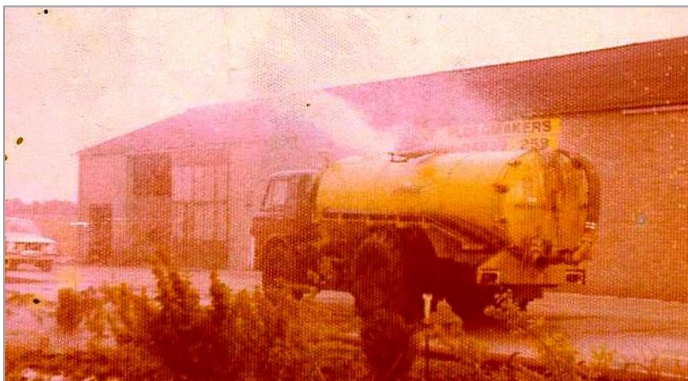
▲ Hier is de waterdouche goed in beeld gebracht.

De vernieuwing die Anton bedacht was de vier meter lange zuigslang aan de opening aan de achterzijde te monteren. De slang werd vervolgens in het midden bovenop de tank vastgemaakt. Aan het uiteinde van de slang werd vervolgens de ketsplaat bevestigd. Als de vrachtauto langzaam langs het brandende bos reed werd het vuur bedolven onder een enorme zware waterdouche. Eerstens door de hoeveelheid water, maar ook omdat er geen lucht meer op die plek was. Een ander voordeel was dat als de tank leeg was kon deze in een sloot weer snel gevuld worden om opnieuw te worden ingezet. Nadien heeft ook de gemeente Venray bij een bosbrand dankbaar gebruik gemaakt van de brandweerideeën van Anton.